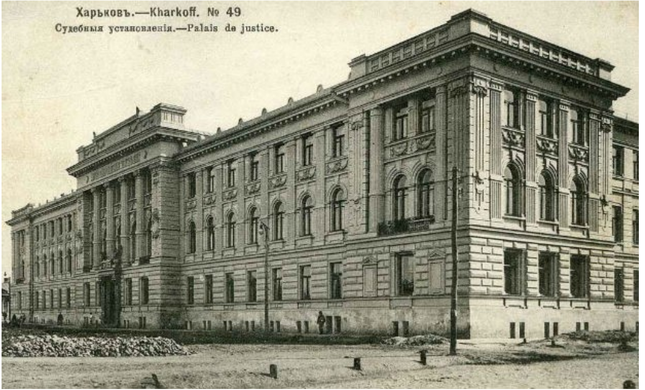
Харьковъ.—Kharhoff. № 49 Судебныя установленія.—Palais de justice.