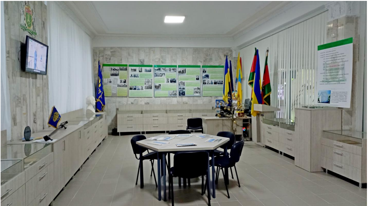
Оновлена експозиція музею, жовтень 2022 р.

Одна з нових експозицій присвячена студентам і співробітникам ОНТУ, які з початком повномасштабного вторгнення росії в Україну боронять Батьківщину в складі Збройних Сил України.